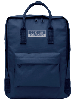
กระเป๋าเป้ Happy Bag มูลค่า 300 บาท

และในเดือนหน้าระหว่างวันที่ 3-5 สิงหาคม 2565 นี้ ขอเชิญท่านสมาชิกไปพบกันในงานสัมมนาพิเศษ หลักสูตร “นักบัญชีในปี 2022 กับสิ่งที่มีการเปลี่ยนแปลง” โดย อ.สุรพล ถวัลย์วิษยจิต